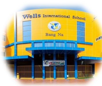
Bang Na Campus