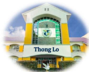
Thong Lo Campus