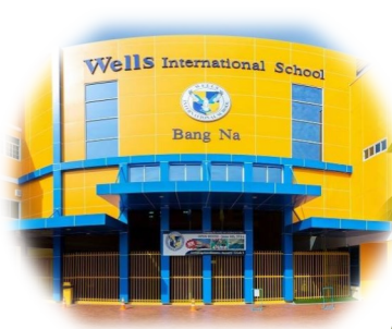
Bang Na Campus