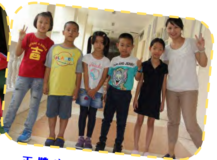
正體字一年級 / 二年級