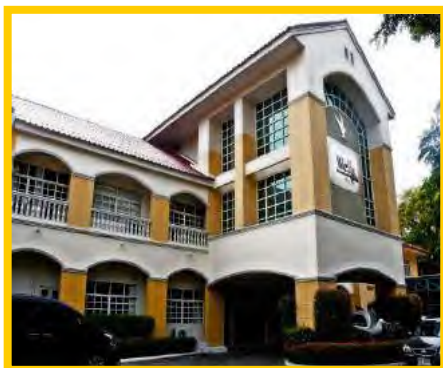
Wells International School Thong Lo Campus (Nursery – G2) 6 Sukhumvit Soi 51, Klongtan-Nua Wattana, Bangkok 10110 Tel: (66)02-662-5980-2 Fax: (66)02-662-5983 http://www.wells-school.com