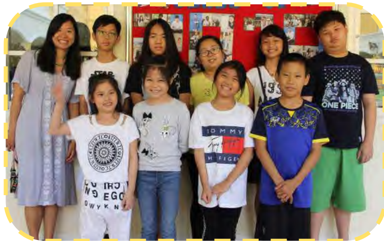
正體字三年級 / 六年級