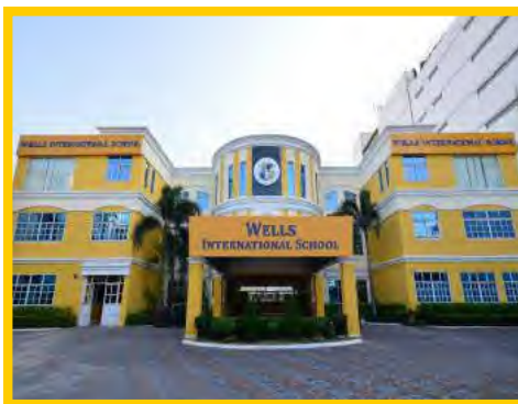
Wells International School On Nut Campus (G1 – G12) 2209 Sukhumvit Road, Bangchak Prakhanong, Bangkok 10260 Tel: (66)02-730-3366 Fax: (66)02-730-3118 http://www.wells-school.com