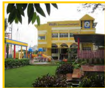
Wells International School Bangna Campus (Nursery – G5) 10 Srinakarin Soi 62, Nongban Pravate, Bangkok 10250 Tel: (66)02-746-6060-1 Fax: (66)02-746-6062 http://www.wells-school.com